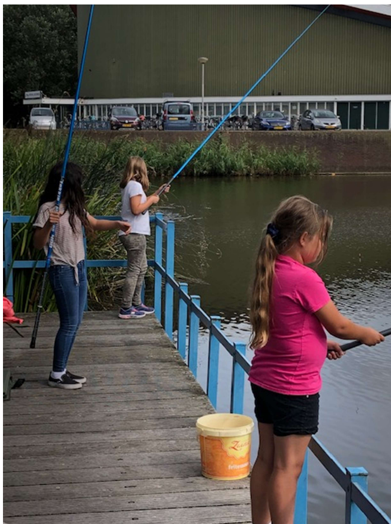
De dames vissen van de steiger in de Sporthalvijver

Met hulp van de vrijwilligers van HSV Kennemerland vingen veel kinderen hun eerste visje en het enthousiasme was groot.